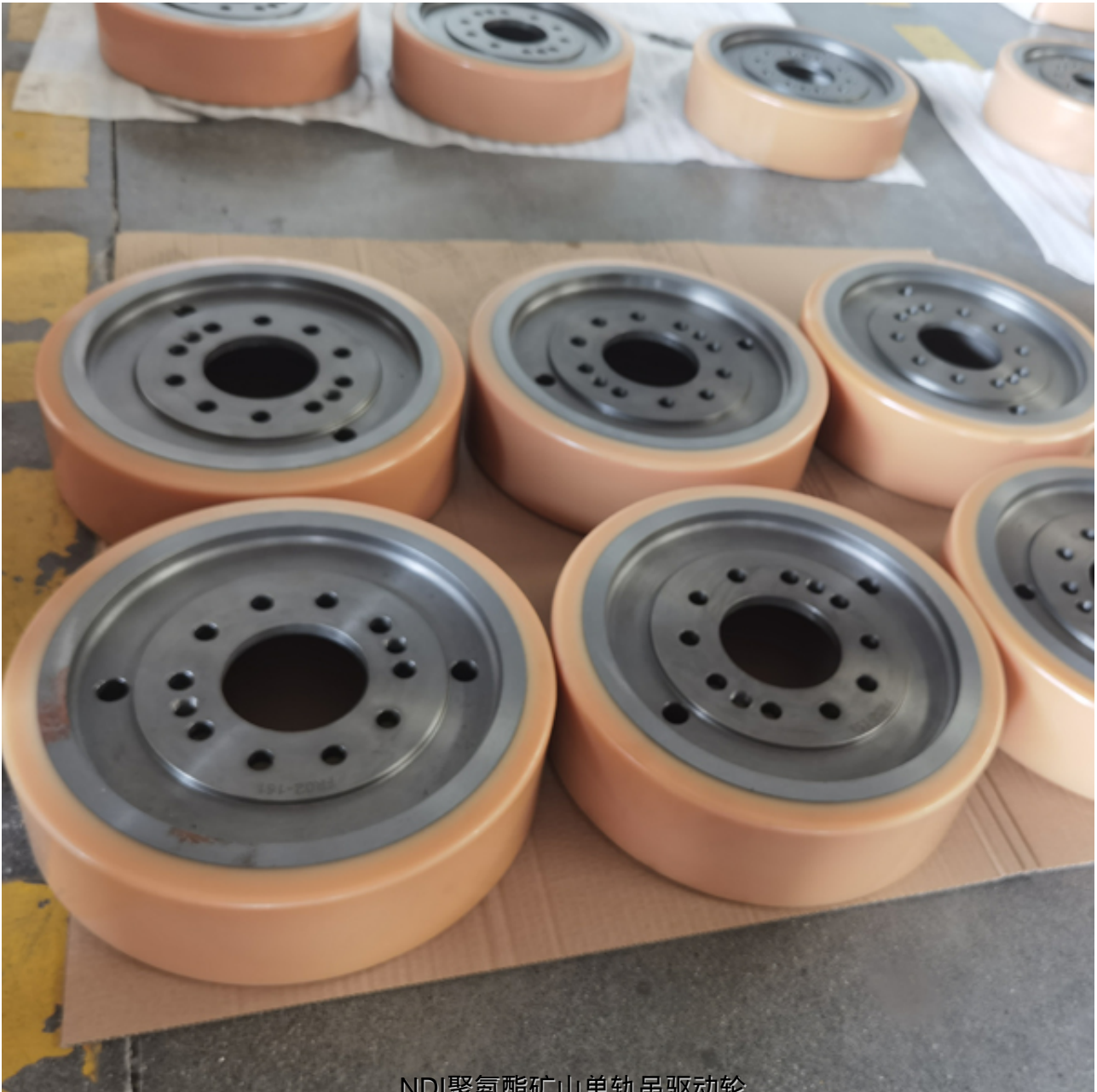
NDI聚氨酯矿山单轨吊驱动轮